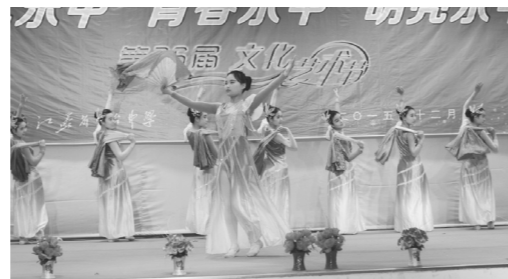
古典舞《清荷》高二(17)班