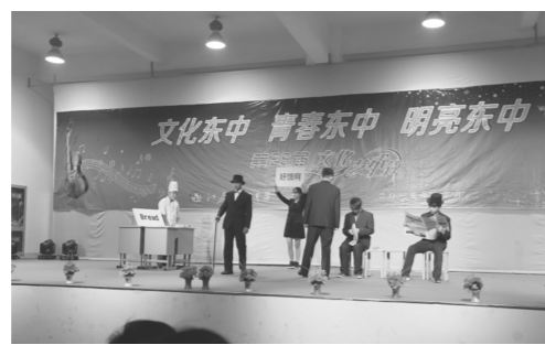
戏剧《谁是小偷?谁是绅士?》高一(2)班