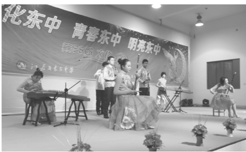
器乐合奏《美丽的神话》高一(1)班