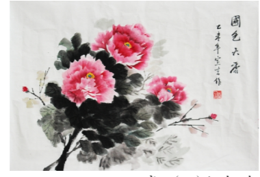
高一(13)班 宣 言